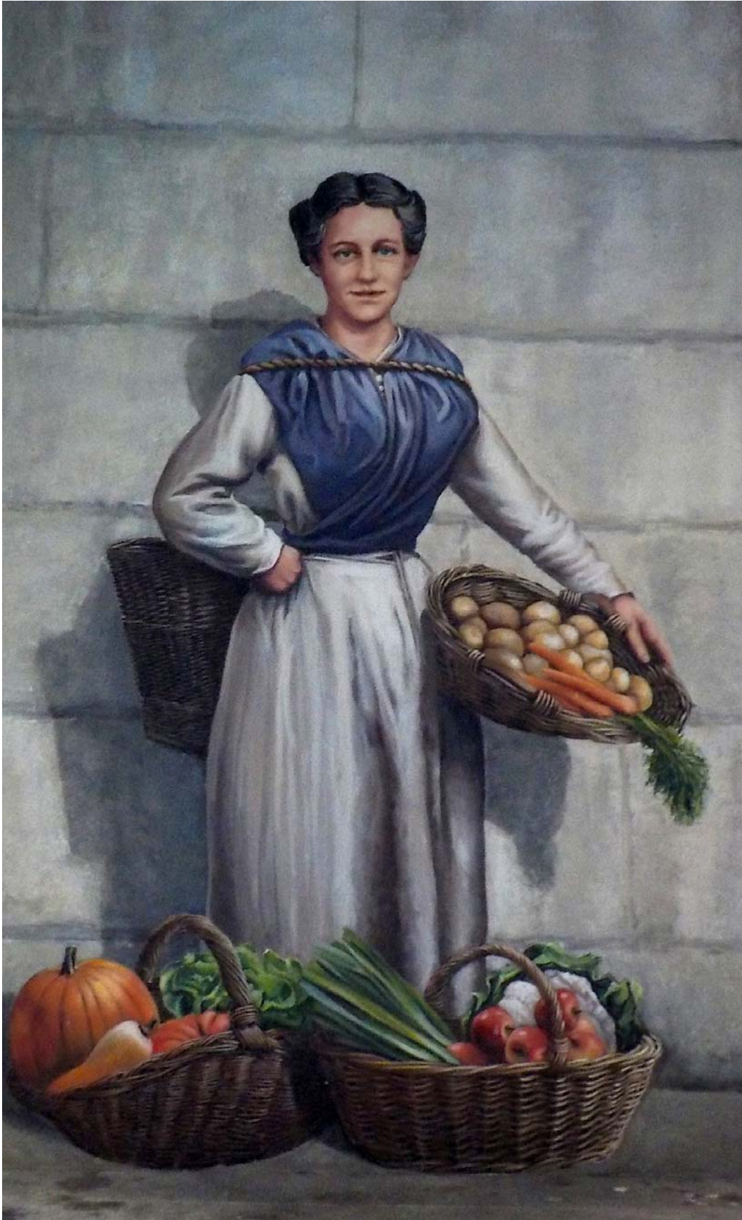
Celle-ci est au fond d'une encoignure, au cœur de la vieille ville...