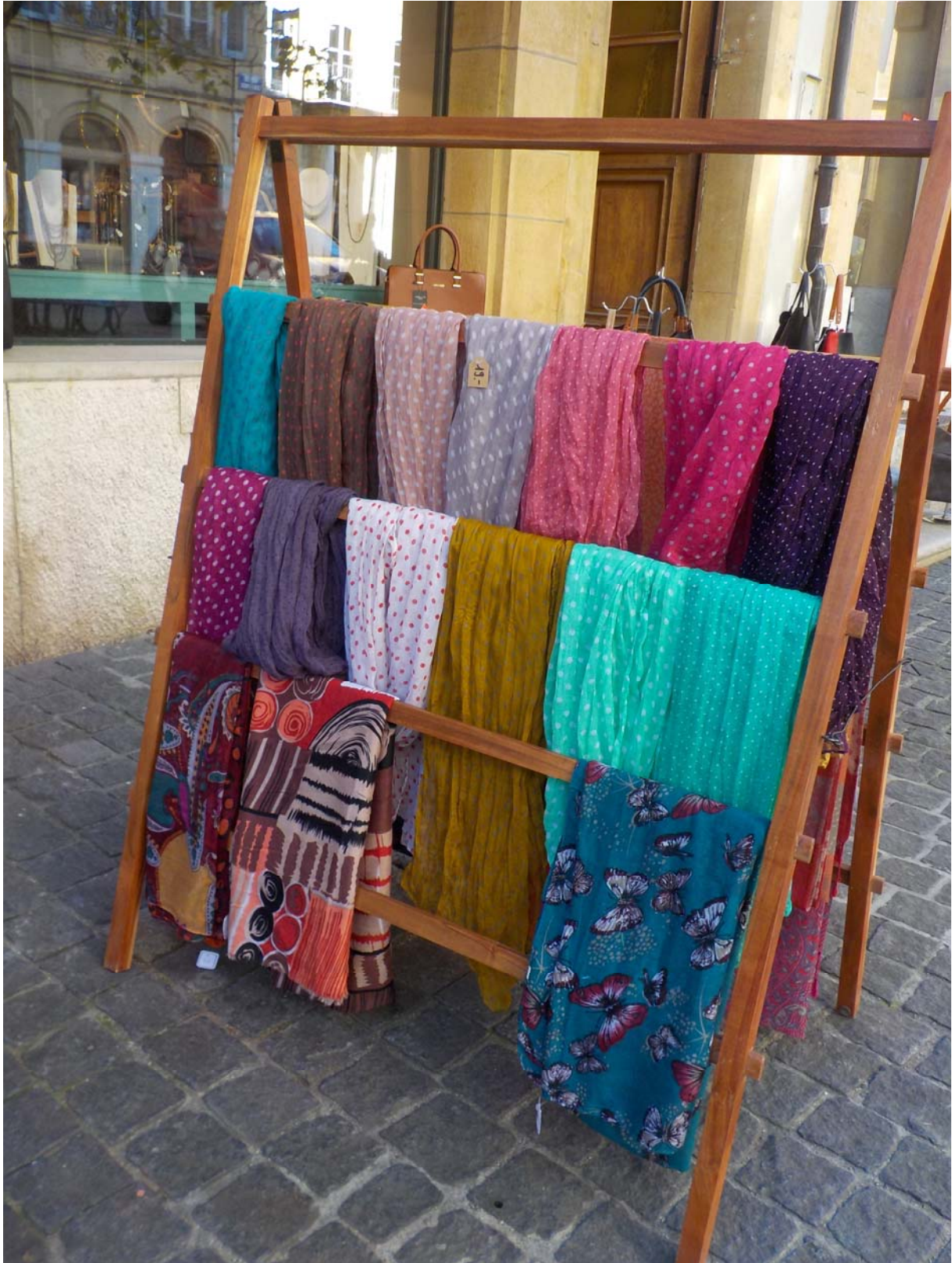
Idem. Pour nous autres, la ville, c'est souvent ça...les couleurs...