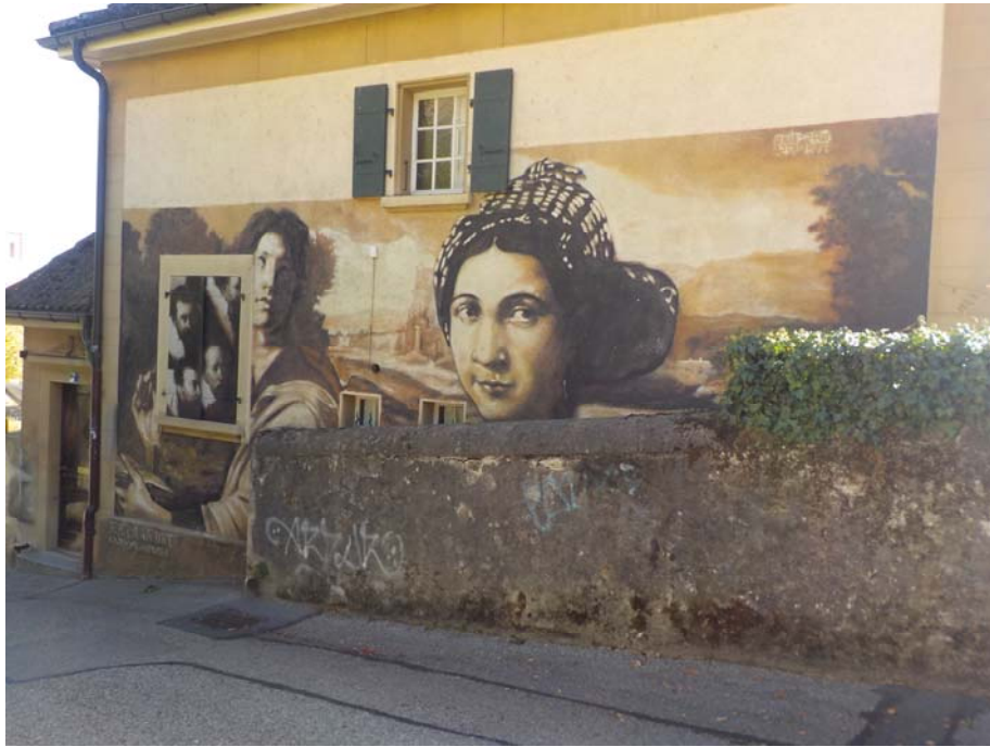
En redescendant de la gare...