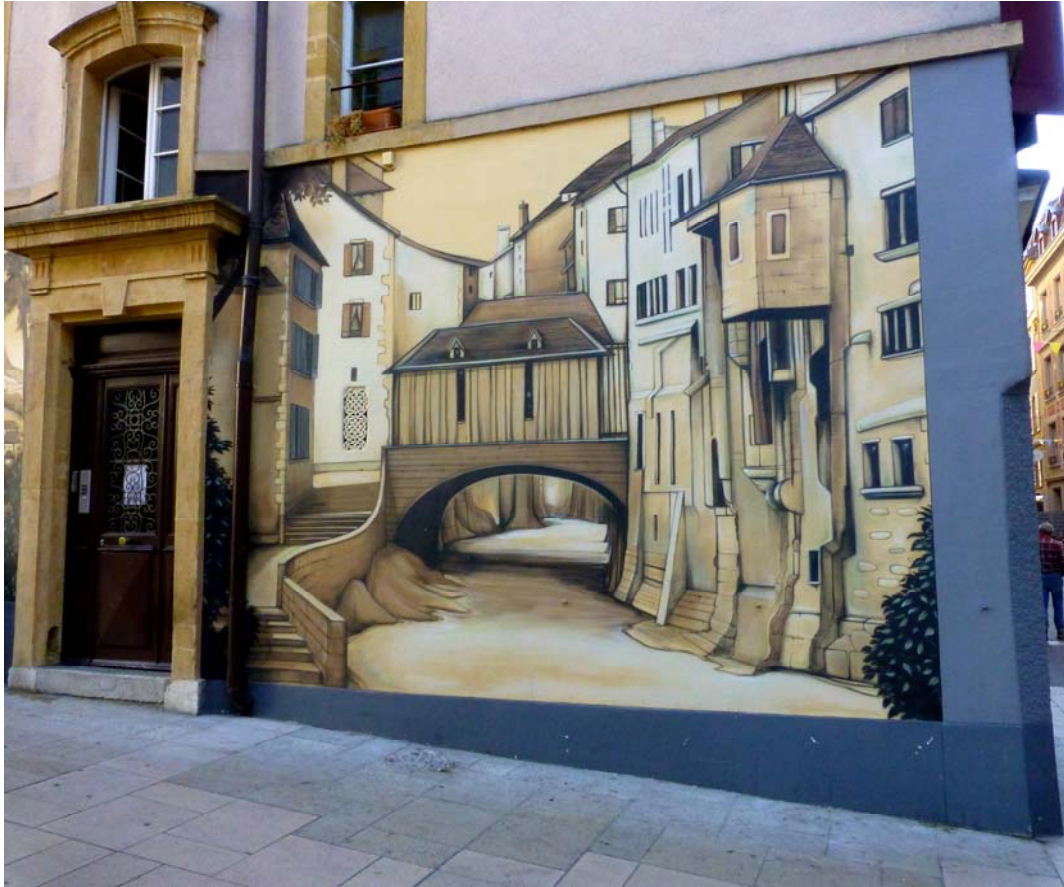
Neuchâtel dans ses sites les plus remarquables se signale...